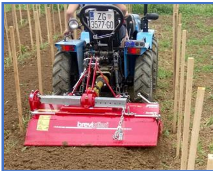
Podizanje novog nasada Kraljevine i korištenje kupljene opreme

Kraljevina je stari autohtoni kultivar vinove loze koji vuče podrijetlo iz vinogorja sjeverozapadne Hrvatske, gdje je i danas rasprostranjena te predstavlja vodeći kultivar u sortimentu zelinskoga vinogorja. Ovim smo projektom učenicima zasigurno već sada podigli svijest o važnosti ove autohtone sorte, a dozvole li uvjeti, provođenjem edukativnih radionica vezanih za sadnju, rezidbu, njegu i zaštitu, kraljevinu ćemo i ubuduće promovirati ne samo među učenicima, nego i među širim građanstvom te istovremeno osnažiti suradnju Škole s lokalnom zajednicom. Zahvaljujući stečenim kompetencijama, po završetku programa povećat će se konkurentnost učenika na tržištu rada, a Škola će steći bolje materijalne uvjete za provođenje vježbi u ovom podsektoru. Valja naglasiti da se sva navedena mehanizacija i oprema koristi ne samo u vinogradu, nego i na ostalim površinama, što projektu daje dodanu vrijednost.