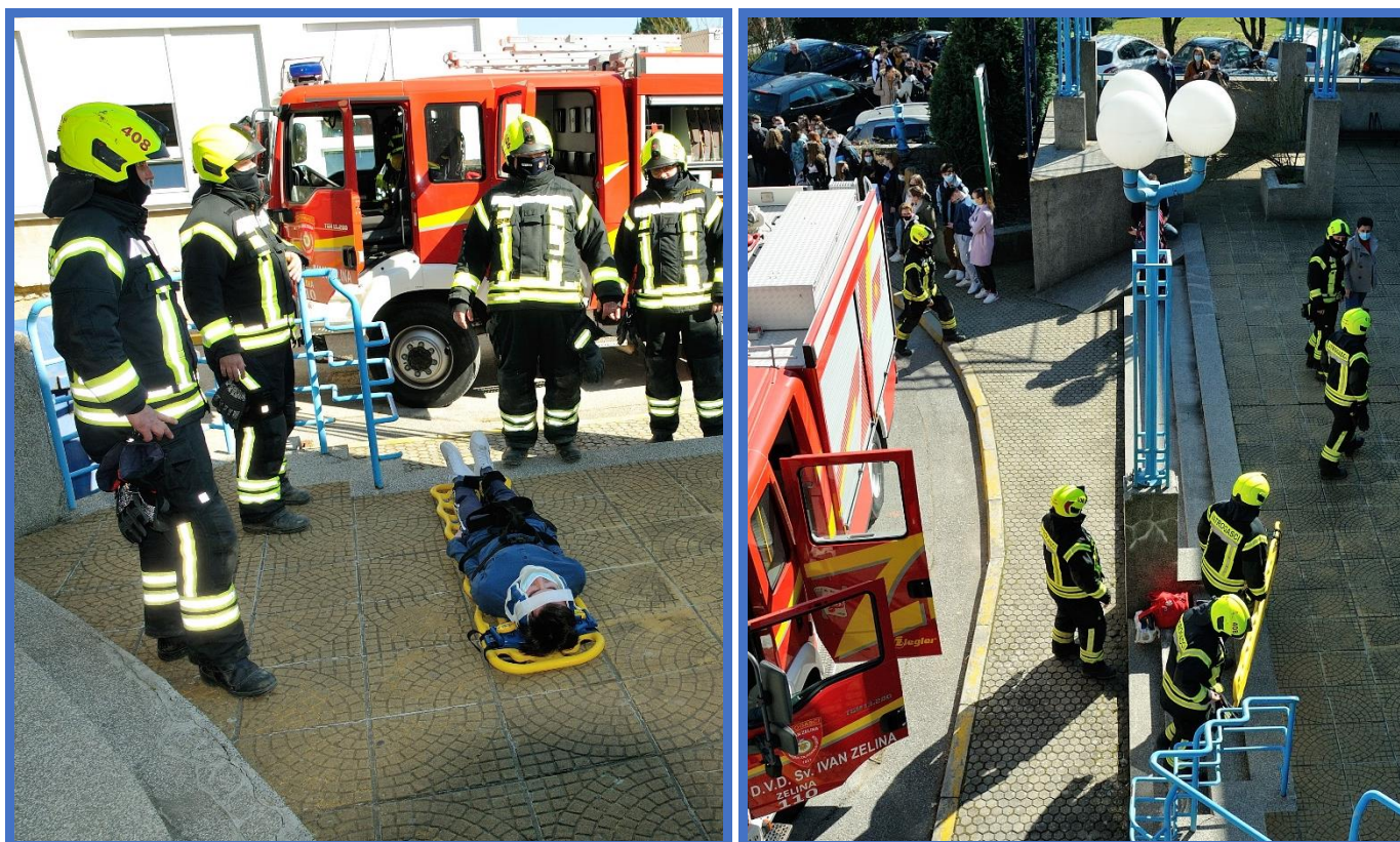
Vježba evakuacije, 3. ožujka 2021.

Nabavljena su nosila, zaštitni šljemovi, reflektirajući prsluci, vatrogasna sirena za oglašavanje opasnosti, lopate, krampovi i druga potrebna oprema. Sve navedeno pohranjeno je zajedno s opremom za pružanje prve pomoći u posebno označenom ormaru u prostoru školske porte. Dodatna je nosila škola pribavila donacijom Gradskog društva Crvenog križa u prosincu 2021.