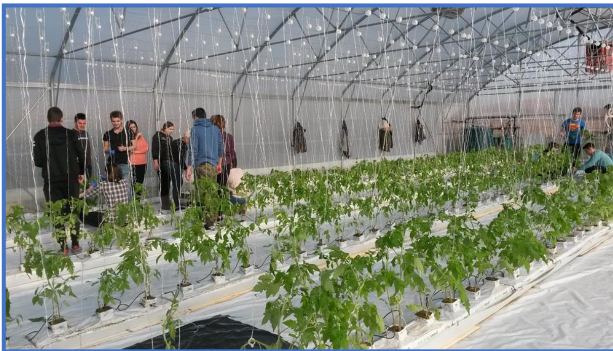
Vježbe u plateniku za hidroponski uzgoj rajčice u periodu prije početka izgradnje radionica

U sklopu već spomenutog EU projekta MOPS u veljači 2016. na parceli iza školske zgrade podignut je platenik s hidroponskim uzgojem površine 200 m 2 , u cijelosti financiran iz Europskog socijalnog fonda. Opremljen je automatskim sustavom za provjetravanje, termogenom, sustavom za opskrbu biljaka hranjivom otopinom te pH i EC metrom za kontrolu hranjive otopine.