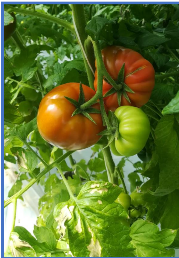
Uzgoj rajčice u plasteniku s hidroponskim uzgojem prije otvaranja gradilišta radionica