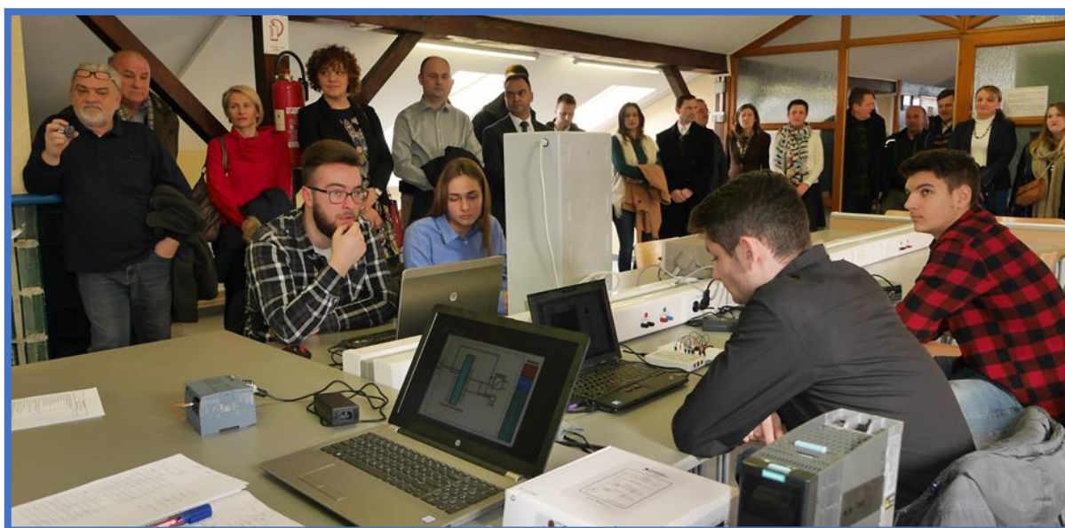
Otvorenje laboratorija za vježbe s područja elektrotehnike i računalstva

U preostalom dijelu potkrovlja koji se koristi za nastavu nalaze se dva laboratorija u kojima se izvode vježbe s područja elektrotehnike. U starijem laboratoriju vježbe obavljaju primarno učenici koji se školuju prema trogodišnjem programu za zanimanje elektroinstalater. Za potrebe održavanja praktične nastave u tom laboratoriju periodično se nabavlja potrošni materijal, a oprema se obnavlja ovisno o raspoloživim novčanim sredstvima. Zahvaljujući sredstvima Zagrebačke županije, u veljači 2018. u prostoru između starijeg elektro laboratorija i knjižnice uređen je novi elektro laboratorij, koji raspolaže suvremenom opremom potrebnom za izvođenje vježbi u sektoru Elektrotehnike i računalstva, a posebno vezano za treću i četvrtu godinu školovanja tehničara za električne strojeve s primijenjenim računalstvom. Za strukovne je nastavnike koji izvode vježbe u tom laboratoriju osigurana dodatna edukacija, koju je provela tvrtka koja je opremila sam laboratorij.