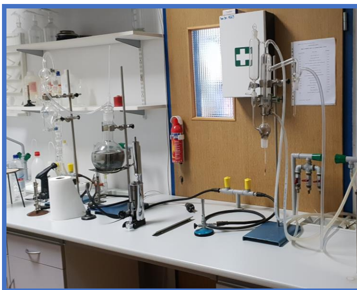
Laboratorij za analizu vina

U protekle tri godine za potrebe vježbi u laboratorijima nabavljena je veća količina opreme i potrošnog materijala, što je omogućilo osuvremenjivanje nastavnog procesa i podiglo ga na višu razinu. Šk. god. 2019./2020. sredstvima MZO-a nabavljeni su digitalni refraktometar, komplet za određivanje ukupnih kiselina i slobodnog SO 2 u moštu i vinu, termometar, areometar te komplet za