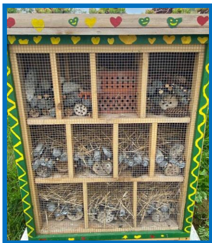
Hotel za kukce

mogućnost održavanja terenske nastave u svojim prostorima, kao i suradnju s učenicima pri izradi završnog rada, što se u proteklom periodu zbog objektivnih izvanjskih okolnosti i epidemioloških mjera nije realiziralo, no bude li to moguće, suradnja će se svakako nastaviti.