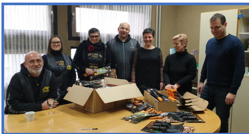
Preuzimanje donacije Moto i offroad kluba

Šk. god. 2020./2021. sredstvima Zagrebačke županije nabavljene su škare za cijepljenje vinove loze, sadnice malina, kupina, lijeske, dunje, oskoruša, mušmula, nektarina, ribiza, lavande, smilja, pelina, ružmarina, hortenzija i lozni cijepovi, kao i potrošni materijali za potrebe laboratorija i školskog vrta. Šk. god. 2021./2022. sredstvima Zagrebačke županije nabavljeni su motorna kosilica, motorna pila, motorna pilica, akumulatorske škare za živicu, flakserica, pipetus i precizne vage. Za potrebe projekta Kompostom do zdravijeg okoliša provedenog u suradnji s DV Proljeće nabavljen je komposter te su učenici dvaput tjedno iz vrtića u neposrednoj blizini škole preuzimali ostatke hrane i odlagali ih u komposter za potrebe školskog vrta. Aktivnost će se nastaviti provoditi u šk. god. 2023./2024. Zahvaljujući projektu Livada iz sna u školskom je vrtu podignut hotel za korisne insekte, kojeg su uz pomoć nastavnika izradili učenici koji se obrazuju za zanimanje stolar, čime je ostvarena izvrsna međusektorska suradnja.