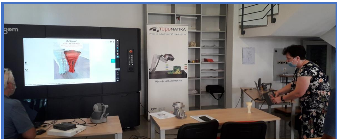
Prva edukacija nastavnika u Svetoj Nedelji, srpanj 2020.

U novom je elektro laboratoriju smještena i oprema koju je škola u srpnju 2020. dobila u sklopu projekta Primjena aditivnih tehnologija u radu s učenicima srednjih škola - Budi 3D kreativan , čije je financiranje sredstvima u iznosu od 200.000,00 kn osigurala Zagrebačka županija na inicijativu Elektrotehničkog društva Zagreb. Provođenje Projekta službeno je započelo u ožujku 2020. danom potpisivanja ugovora između Zagrebačke županije i Elektrotehničkog društva Zagreb, a završilo u listopadu 2020. Projekt je inicijalno uključivao teoretsku i praktičnu obuku pet nastavnika i strukovnih učitelja na suvremenim sofisticiranim uređajima za 3D printanje, a stečena bi znanja nastavnici tijekom redovne nastave ili u sklopu izvannastavnih aktivnosti prenosili učenicima. No, u konačnici je na prvoj edukaciji, održanoj u prostorima tvrtke Izit d.o.o. u Svetoj Nedelji u srpnju 2020. sudjelovalo 7 nastavnika (Mateja Benjak, Klara Jasna Žagar, Silvija Kožić, Marijan Antolković, Zoran Lukić, Branimir Horvat i Ivan Žugaj), kao i ravnateljica Martina Zerec. Tom je prilikom škola zaprimila uređaj za brzu izradu prototipova koji koristi LPD Plus ( Layered Plastic Deposition ) tehnologiju 3D ispisa; GEOMAGIC Sculpt programski paket i haptičku force feedback ruku; ručni 3D skener u boji za potrebe digitalizacije objekata; prijenosno računalo s odgovarajućim softverom, te gradive i potporne materijale potrebne za printanje odnosno izradu modela.