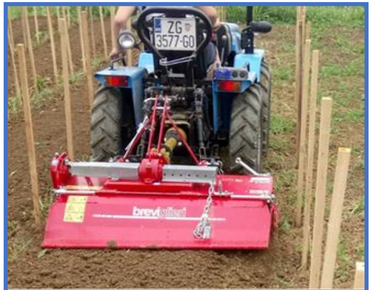
Podizanje novog nasada Kraljevine i korištenje kupljene opreme

Kraljevina je stari autohtoni kultivar vinove loze koji vuče podrijetlo iz vinogorja sjeverozapadne Hrvatske, gdje je i danas rasprostranjena, te predstavlja vodeći kultivar u sortimentu zelinskoga vinogorja. Ovim smo projektom učenicima zasigurno već sada podigli svijest o važnosti ove autohtone sorte, a dozvole li epidemiološki uvjeti, provođenjem edukativnih radionica vezanih za sadnju, rezidbu, njegu i zaštitu, kraljevinu ćemo i ubuduće promovirati ne samo među učenicima, nego i među širim građanstvom te istovremeno osnažiti suradnju Škole s lokalnom zajednicom. Zahvaljujući stečenim kompetencijama, po završetku programa povećat će se konkurentnost učenika na tržištu rada, a Škola će steći bolje materijalne uvjete za provođenje vježbi u ovom podsektoru. Valja naglasiti da