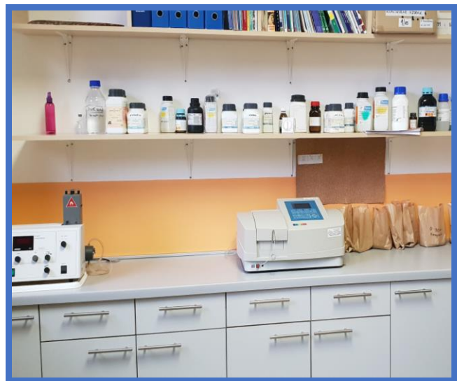
Laboratorij za analizu tla

U protekle dvije godine za potrebe vježbi u laboratorijima nabavljena je veća količina opreme i potrošnog materijala, što je omogućilo osuvremenjivanje nastavnog procesa i podiglo ga na višu razinu. Šk. god. 2019./2020. sredstvima MZO-a nabavljeni su digitalni refraktometar, komplet za određivanje ukupnih kiselina i slobodnog SO 2 u moštu i vinu, termometar, areometar, te komplet za mjerenje hlapive kiselosti. Šk. god. 2020./2021. sredstvima Zagrebačke županije