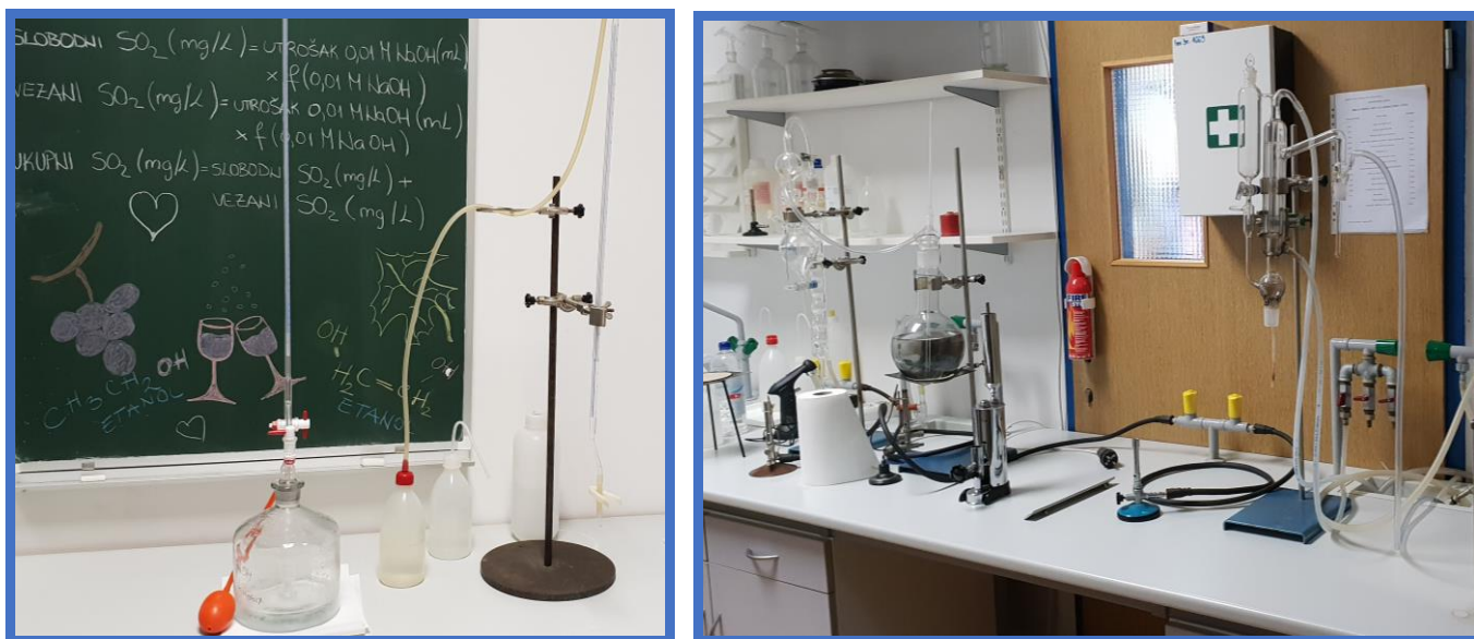
Laboratorij za analizu vina

Ukoliko će Ministarstvo poljoprivrede ili slična institucija u narednom periodu raspisati natječaj za dodjelu sredstava, naš je plan prijaviti projekt kojim bismo spomenute laboratorije dodatno opremili i time omogućili učenicima da se upoznaju s najnovijim tehnološkim dostignućima u tom području.