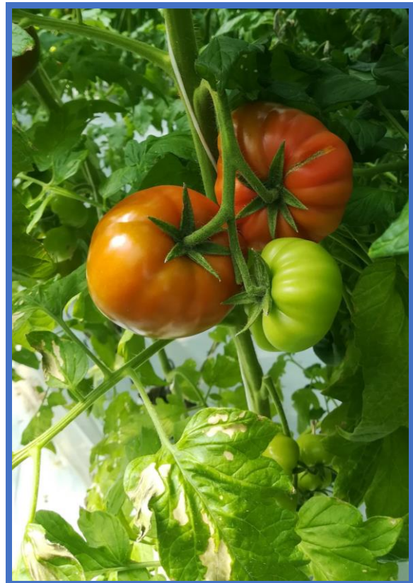
Uzgoj rajčice u plasteniku s hidroponskim uzgojem

Za potrebe podsektora poljoprivrede u posljednjih je nekoliko godina nabavljena veća količina opreme, primarno vezano za potrebe vježbi u laboratorijima, te veća količina stručne literature, koja će se koristiti kako za potrebe redovne, tako i izborne i fakultativne nastave.