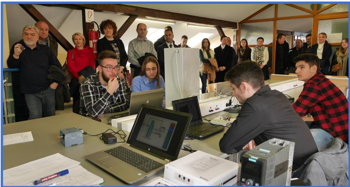
Otvorenje laboratorija za vježbe s područja elektrotehnike i računalstva

U preostalom dijelu potkrovlja koji se koristi za nastavu nalaze se dva laboratorija u kojima se izvode vježbe s područja elektrotehnike. U starijem laboratoriju vježbe obavljaju primarno učenici koji se školuju prema trogodišnjem programu za zanimanje elektroinstalater. Za potrebe održavanja praktične nastave u tom laboratoriju periodično se nabavlja potrošni materijal, a oprema se obnavlja ovisno o raspoloživim novčanim sredstvima. Zahvaljujući sredstvima Zagrebačke županije, u veljači 2018. u prostoru između starijeg elektro laboratorija i knjižnice uređen je novi elektro laboratorij, koji raspolaže suvremenom opremom potrebnom za izvođenje vježbi u sektoru Elektrotehnike i računalstva, a posebno vezano za treću i četvrtu godinu školovanja tehničara za električne strojeve s primijenjenim računalstvom. Za strukovne je nastavnike koji izvode vježbe u tom laboratoriju osigurana dodatna edukacija, koju je provela tvrtka koja je opremila sam laboratorij. Prostor jednog i drugog elektro laboratorija također je pokrećen, u starijem je postavljen novi, veći radijator, a u srpnju 2018. u njemu je izvršena i obnova parketnog poda. U preostalom dijelu potkrovlja u prosincu 2016. postavljen je epoksidni pod, koji zasad nije bilo potrebno sanirati. Za potrebe korištenja nove opreme izvršeni su i potrebni elektroinstalaterski radovi.