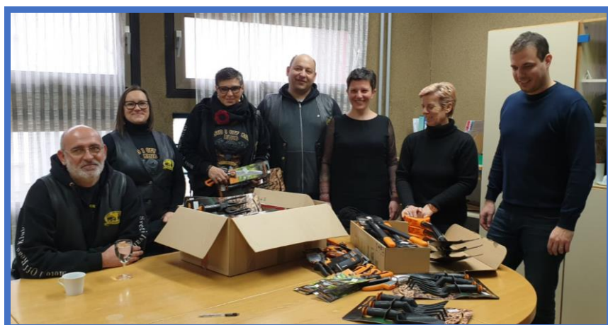
Preuzimanje donacije Moto i offroad kluba