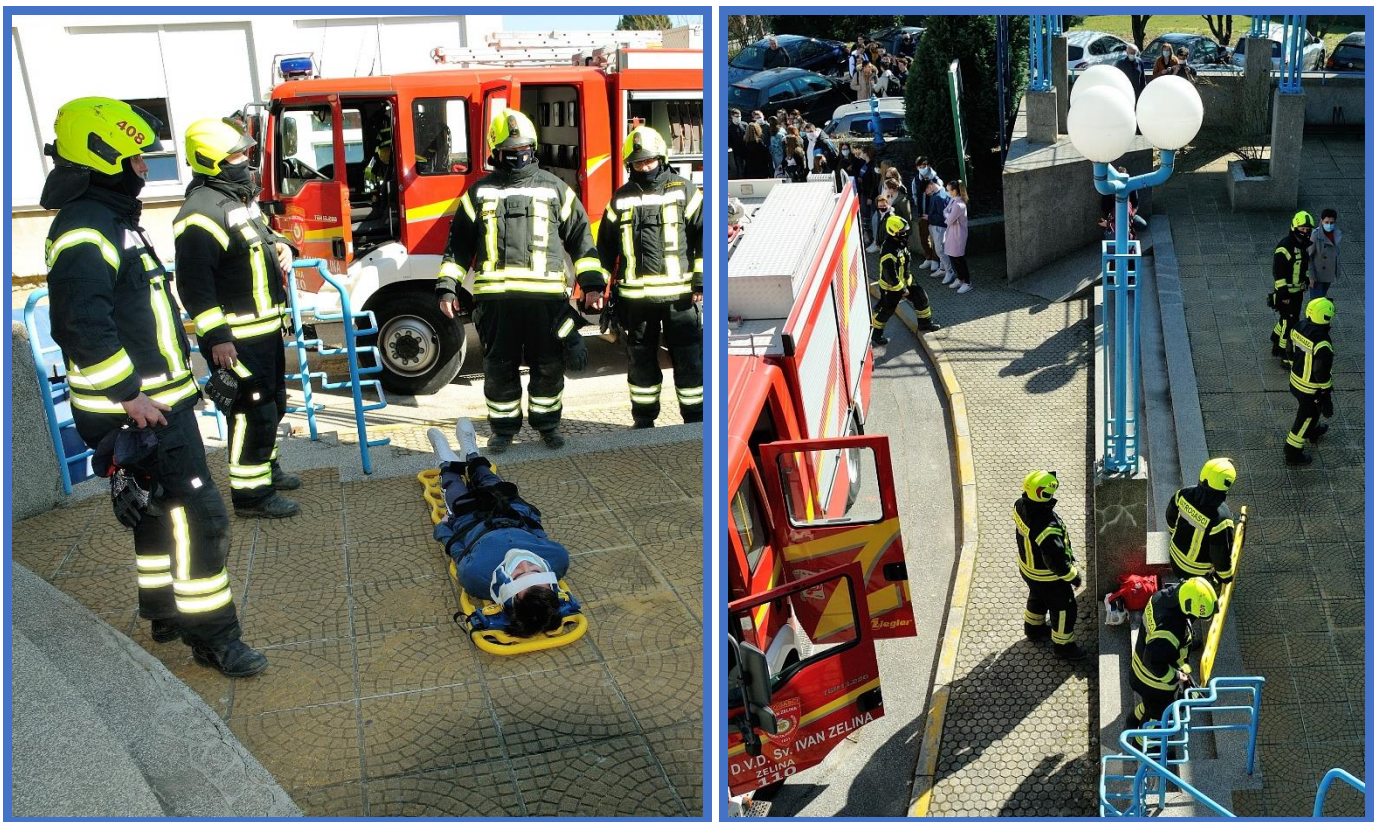
Vježba evakuacije, 3. ožujka 2021.

Nabavljena su nosila, zaštitni šljemovi, reflektirajući prsluci, vatrogasna sirena za oglašavanje opasnosti, lopate, krampovi i druga potrebna oprema. Sve navedeno pohranjeno je zajedno s opremom za pružanje prve pomoći u posebno označenom ormaru u prostoru školske porte.