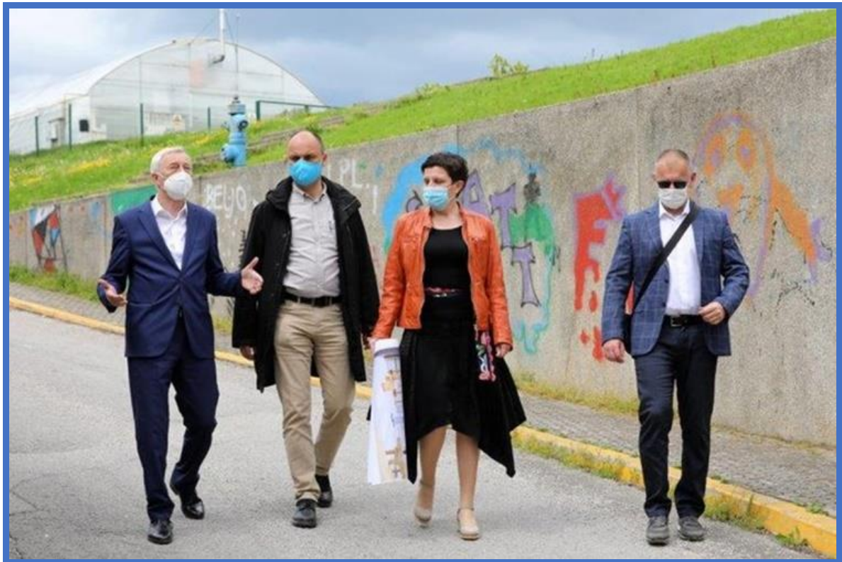
Posjet župana Kožića Školi povodom najave pokretanja postupka javne nabave, 30. travnja 2021.

strojarskim i elektro smjerovima, te smo kroz kontakte s Gradom i Županijom stvorili temelje za projekt izgradnje školskih radionica. Projektna je dokumentacija u cijelosti završena, proveden je postupak javne nabave, te je Zagrebačka županija u svojstvu Naručitelja izabrala izvođača radova, tvrtku Građevinarstvo Stipić. Ugovor o javnim radovima između Naručitelja i Izvođača potpisan je 26. kolovoza 2021., a očekivano je trajanje radova 9 mjeseci.