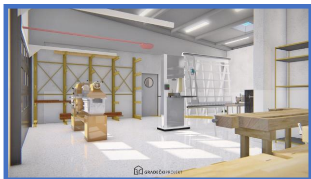
Planirani eksterijer i interijer radionica; izvor: Gradečki Projekt

Vezano za računalnu opremu, uz pomoć sredstava dobivenih od Županije u prosincu 2014. godine informatička je učionica opremljena sa 16 kvalitetnih računala, koja su od velike važnosti za realizaciju strukovnih predmeta u svim strukovnim programima. Ta se računala redovito održavaju i servisiraju, a